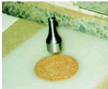
Abbildung 4: Der Fallkörper