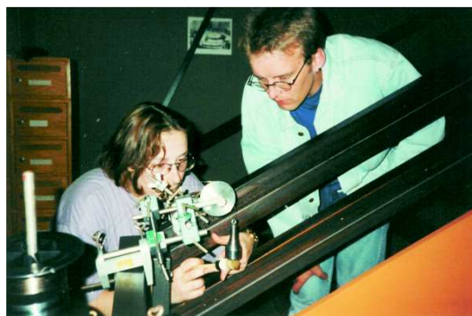
Abbildung 5: Vorbereitung zum Start